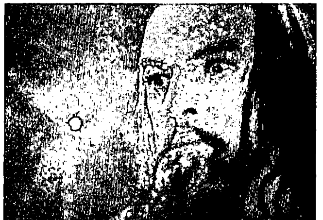
• IVAN LE TERRIBLE • : SEQUENCE DES FUNERAILLES D'ANASTASIA (SUITE)